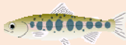
赤い斑点(朱点)が無いのがヤマメ